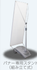
バナー専用スタンド (組み立て式)