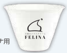
フェリーナ用 紙カップ